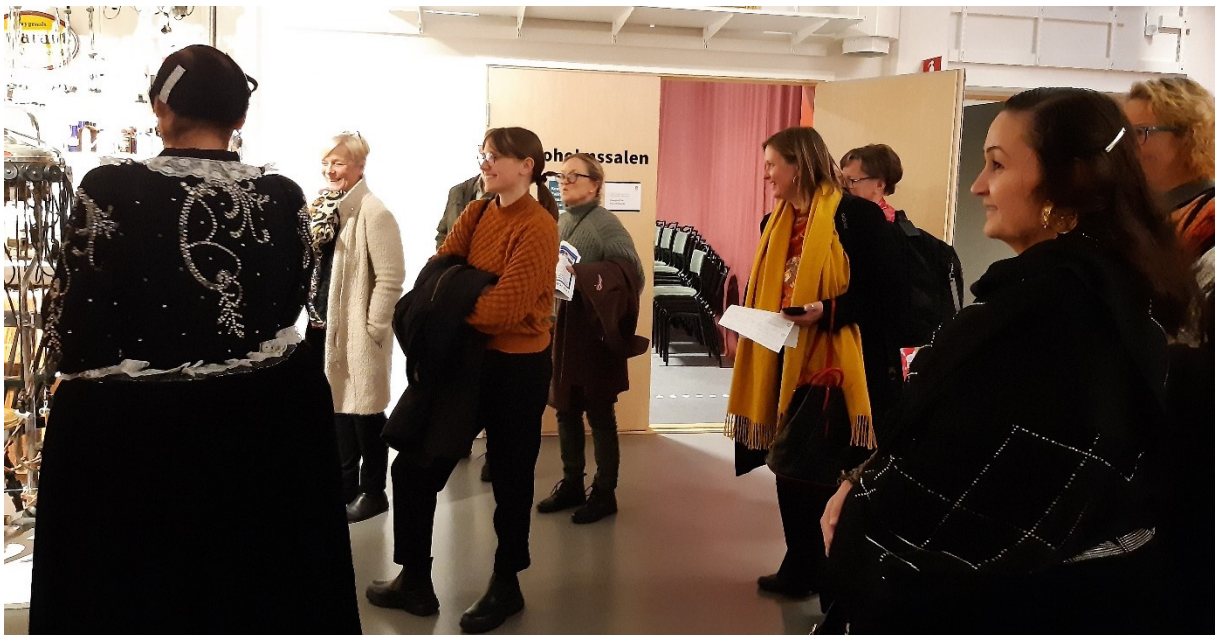
Bild från dialogkvällen på Kulturfabriken 13 oktober.

Flera av deltagarna berättade efter dialogkvällen att de tyckte att det var fint att få delta. SLA skrev en bra artikel om dialogkvällen: https://www.sla.se/2021/10/13/kommunen-bjud-in-for-att-samtala-om-kultur-for-nationella-minoriteter/?loggedIn=true