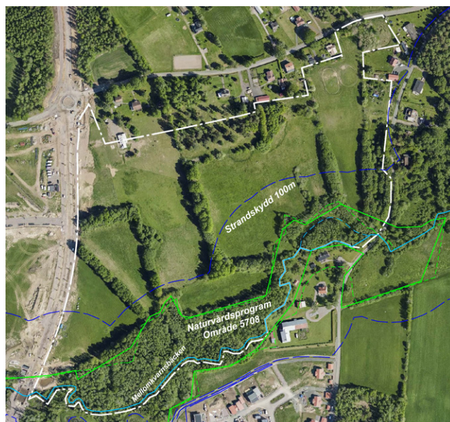
Strandskydd runt Mellomkvarnsbäcken (blå streckad). Lövsskogsinventering från 1991 (streckad grön) sammanfaller i stort med område 5708 i Naturvårdsprogrammet (grön heldragen).

Det råder strandskydd på 100 meter norr om Mellomkvarnsbäcken, se bild nedan.