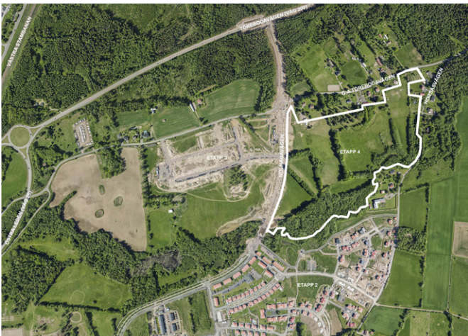
Ortofoto från juni 2019 med en preliminär avgränsning av planområdet.

Detaljplanen berör den fjärde och sista etappen för utbyggnaden av Trädgårdsstaden i enlighet med upprättat Planprogram för Horsås trädgårdsstad . Detaljplanen ska föreslå en småskalig blandad bostadsbebyggelse i enlighet med planprogrammet. Etapp 4 kommer huvudsakligen angöras från Nohlagavägen, troligtvis kompletterad med en mindre koppling i nordöst till Gamla Törebodavägen.