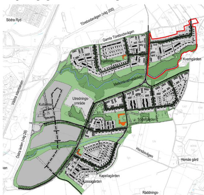
Illustration till Planprogram för Horsås trädgårdsstad med planområdet för etapp 4 markerade i rött.

Etapp 4 är den sista av Trädgårdsstadens etapper som ingår i Planprogram för Horsås trädgårdsstad . Planprogrammet, som godkändes av kommunfullmäktige 2008, beskriver de översiktliga förutsättningarna för att omvandla dagens halvöppna landskap till en attraktiv och välfungerande ny stadsdel för boende med den klassiska trädgårdsstaden som förebild. Målet med programmet är att ge en gemensam grund för utformningen av de olika etapperna i området och skapa förutsättningar för en etappvis utbyggnad under längre tid utan att de ursprungliga intentionerna går förlorade.