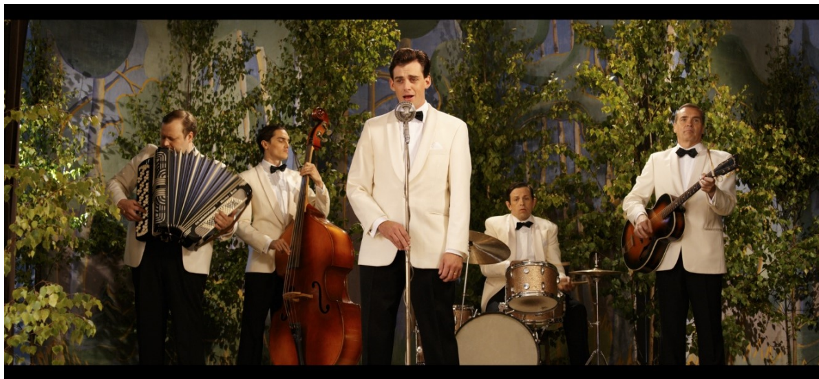
Filmen om den finska sångaren Olavi Virta var den mest sedda finska filmen i Skövde 2019.