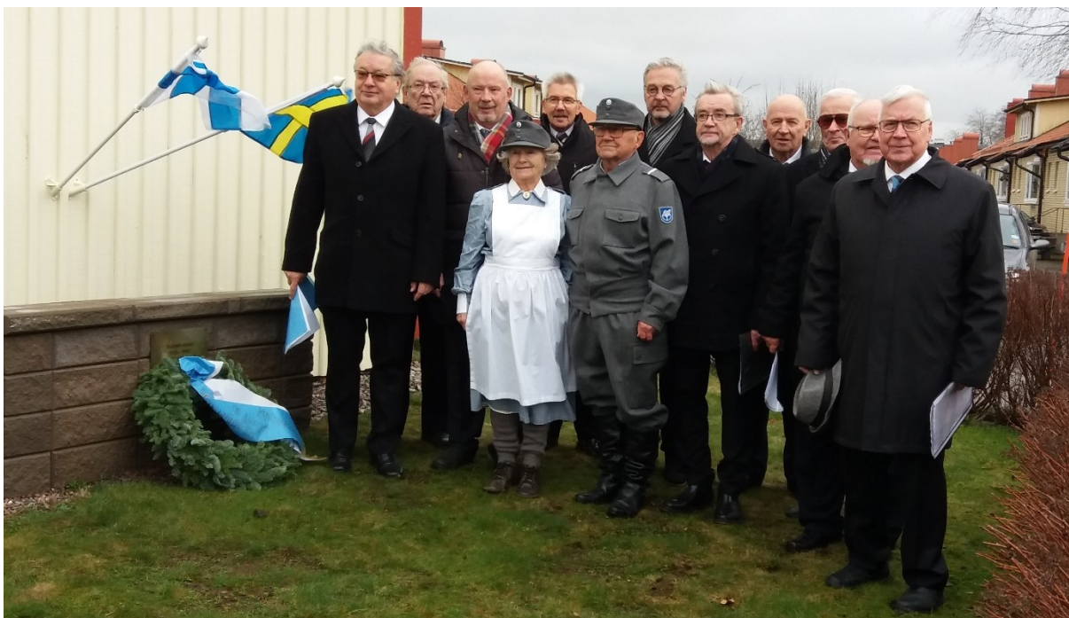
Pensionärsföreningen Vipinäs kör sjöng bland annat Veteranens kvällssång (Veteraanin iltahuuto) när de finska krigsveteranerna hedrades med en krans på Finlands självständighetsdag den 6 december.

Skövde finska förening stod på tur för att arrangera firandet av Finlands självständighetsdag. Dagen firades den 6 december med en mottagning på Finnhoivi i Södra Ryd. Skövde finska förenings kör Mettäläiset stod för underhållningen under kvällen. Finskt förvaltningsområde bidrog med den budgeterade summan 10 000 kr. Antal besökare: c:a 60 personer