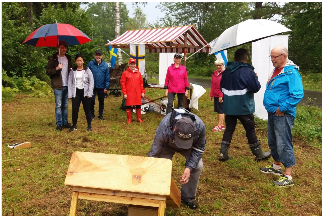
Både volontärer och besökare trotsade regnet på Friskvårdens dag 1/9 på Billingen. Många kastade kedja och stövel.