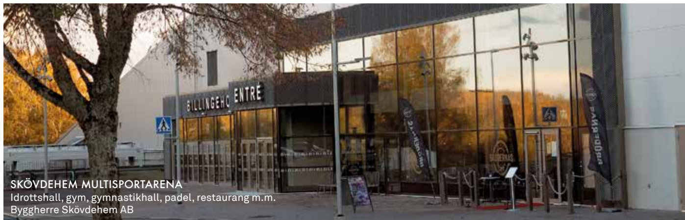
SKÖVDEHEM MULTISPORTARENA Idrottshall, gym, gymnastikhall, padel, restaurang m.m. Byggherre Skövdehem AB