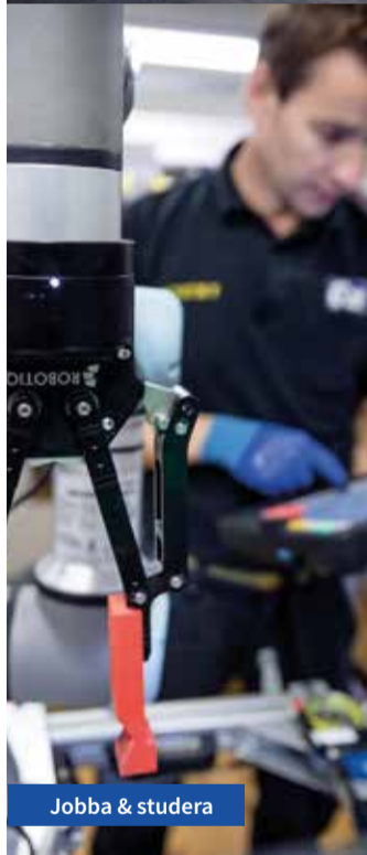
Jobba &amp; studera