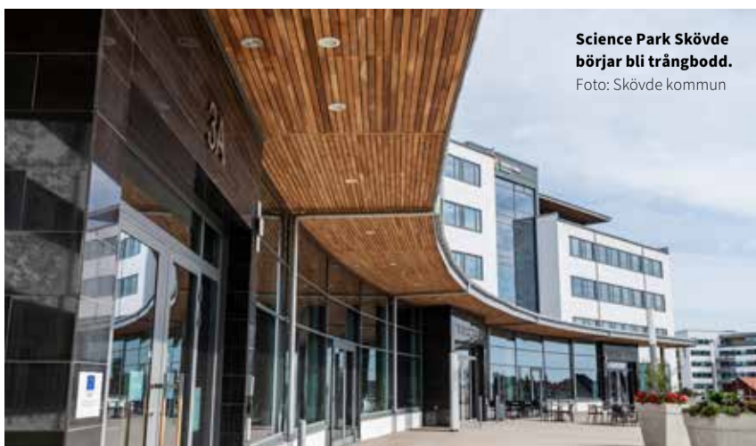
Science Park Skövde börjar bli trångbodd.