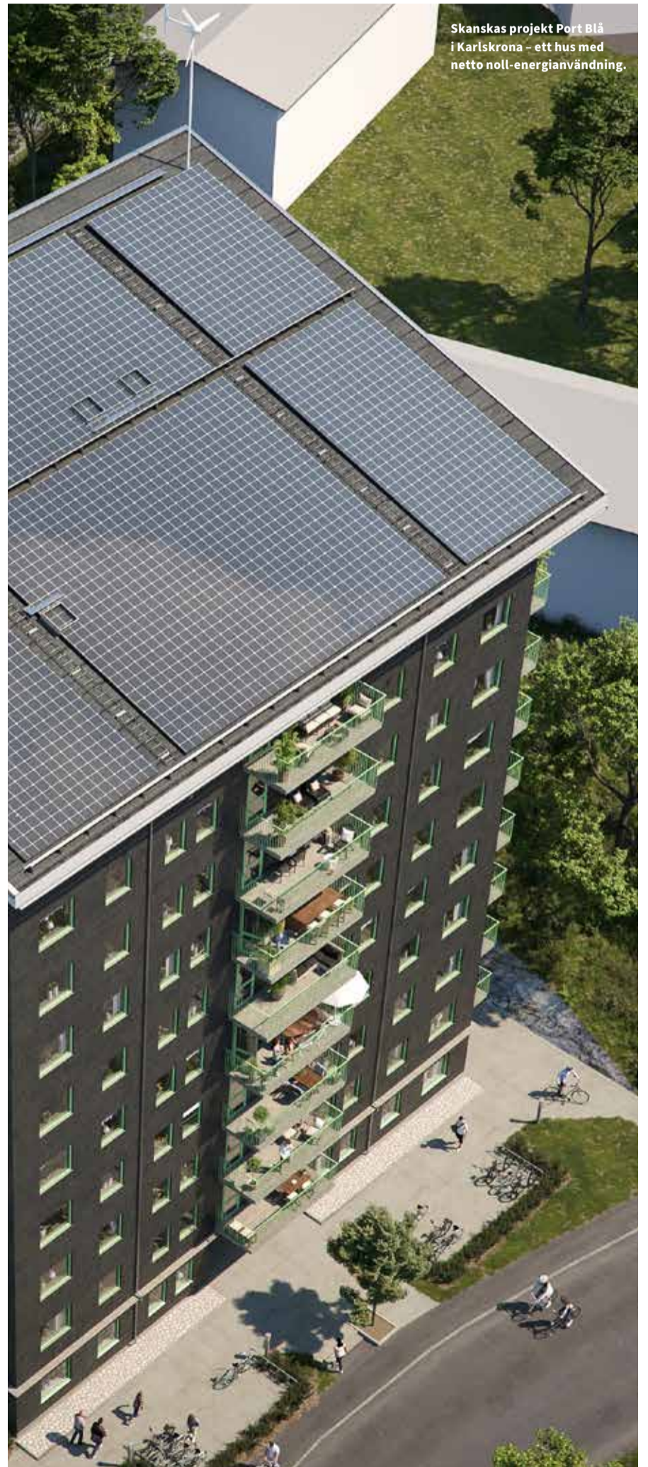
Skanskas projekt Port Blå i Karlskrona – ett hus med netto noll-energianvändning.