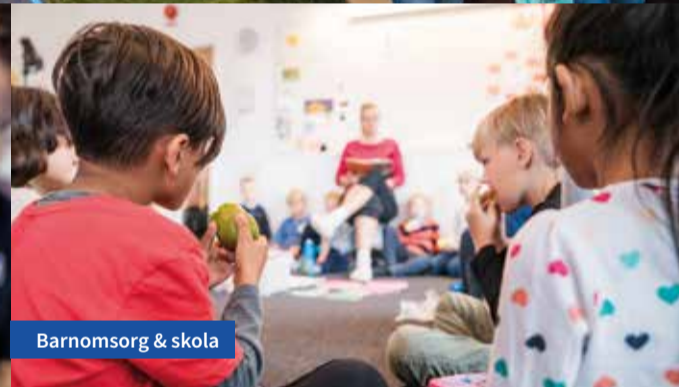
Barnomsorg &amp; skola