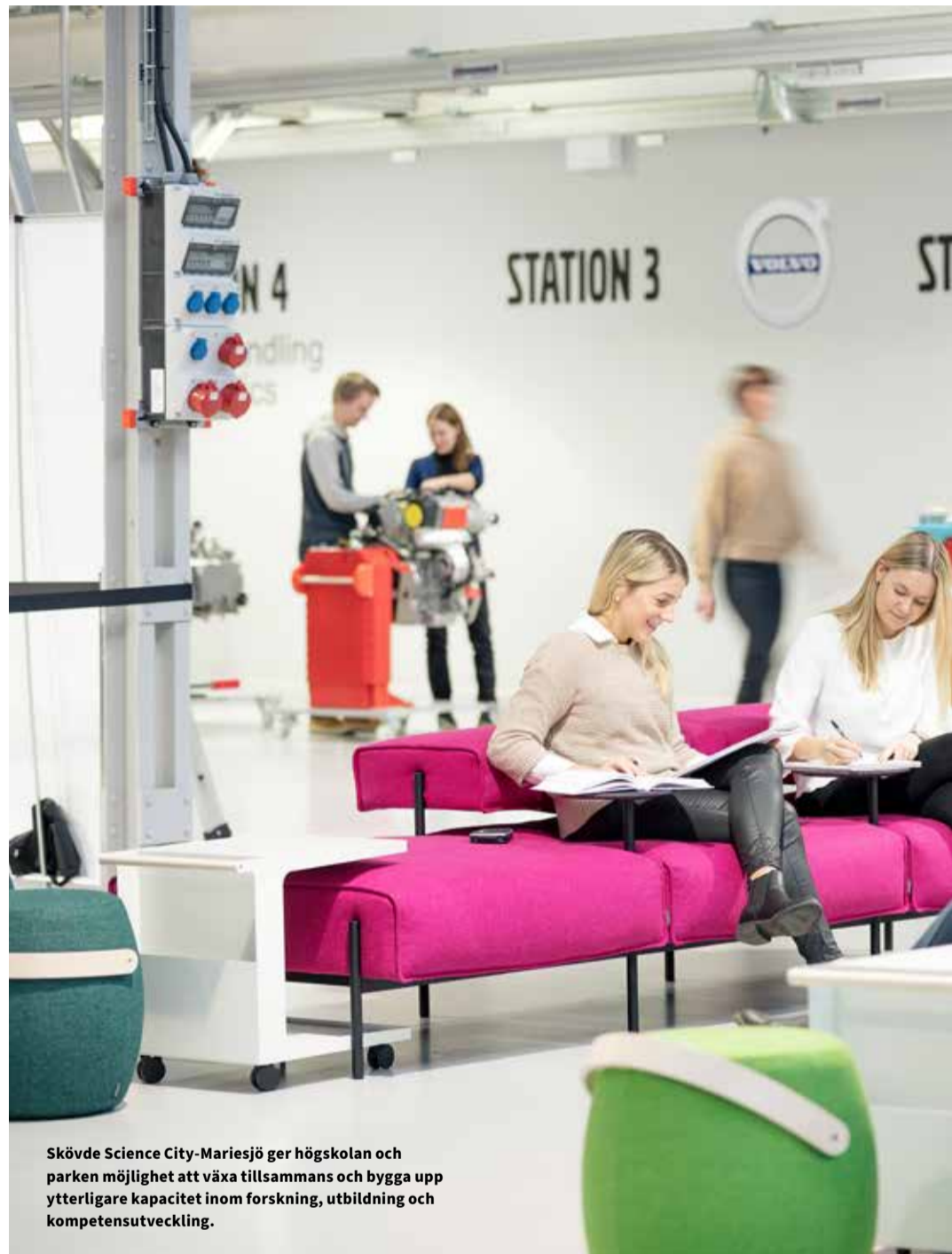
Skövde Science City-Mariesjö ger högskolan och parken möjlighet att växa tillsammans och bygga upp ytterligare kapacitet inom forskning, utbildning och kompetensutveckling.

– Det är flera komponenter som gör att vi levererar otroligt mycket till kommunen. Vi säkerställer att de talanger som rekryteras till högskolan också stannar i Skövde och Skaraborg, utvecklas och bygger näringslivet. På grund av bolagen får vi ett levande näringsliv som ligger i framkant. Det gör att vi skapar väldigt mycket skatteintäkter och kan få hit