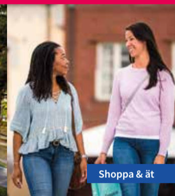
Shoppa &amp; ät