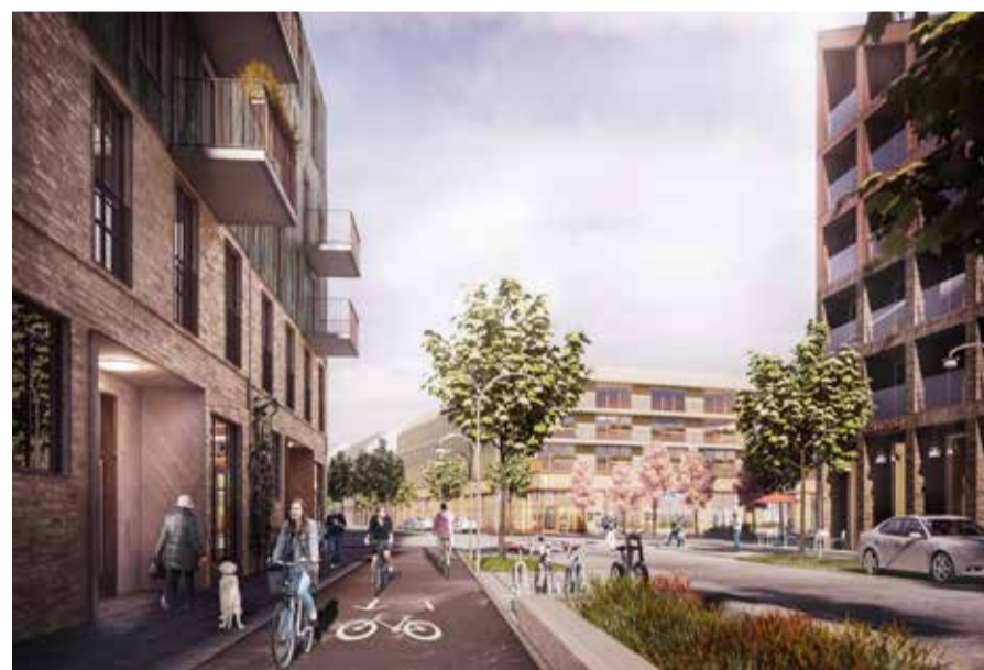
Här växer en hållbar stadsdel fram.

Något som diskuteras är hur pandemin kommer att påverka våra framtida bostäder. Trenden visar att människor kommer att fortsätta arbeta hemifrån i viss utsträckning även fortsättningsvis, vilket lett till diskussioner om hur man kan ge framtidens