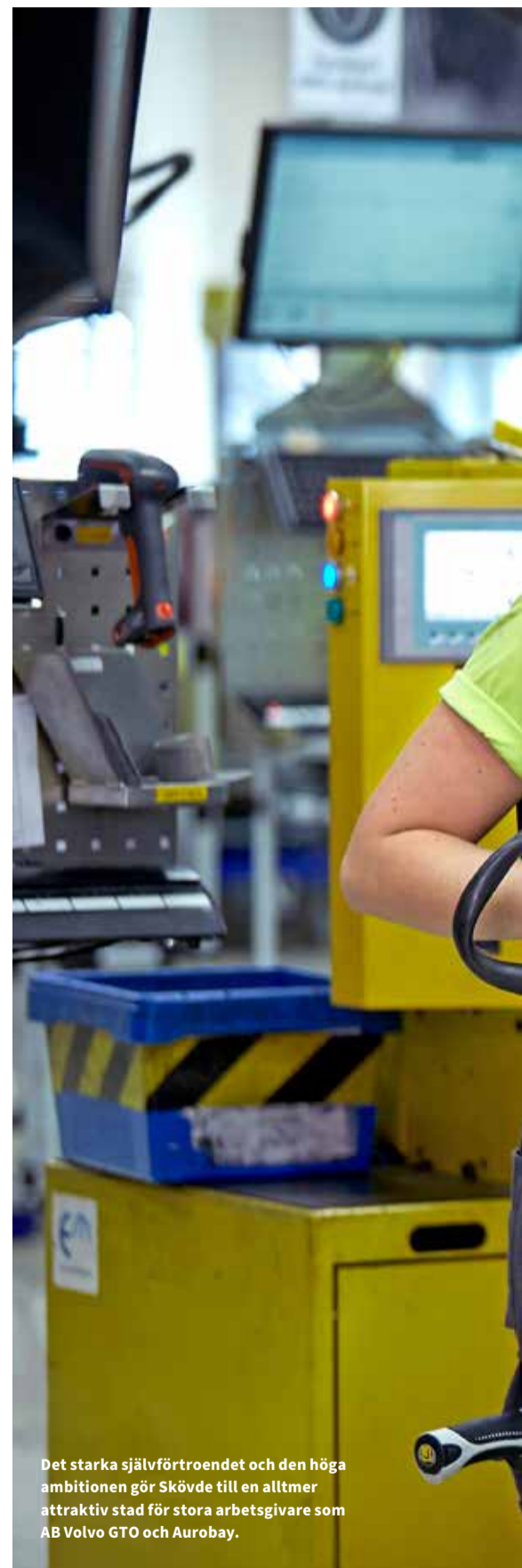
Det starka självförtroendet och den höga ambitionen gör Skövde till en alltmer attraktiv stad för stora arbetsgivare som AB Volvo GTO och Aurobay.