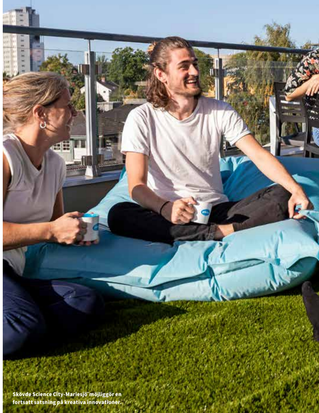
Skövde Science City-Mariesjö möjliggör en fortsatt satsning på kreativa innovationer.

trångbodd. Parken ligger i framkant med smart industri, fintech och dataspelutveckling, men stödjer allt som är skalbart, till exempel gröna näringar som är oerhört viktigt för både kommun och region. Företag som kommer utifrån väljer att etablera sig i Skövde på grund av den gedigna kompetens som finns här.