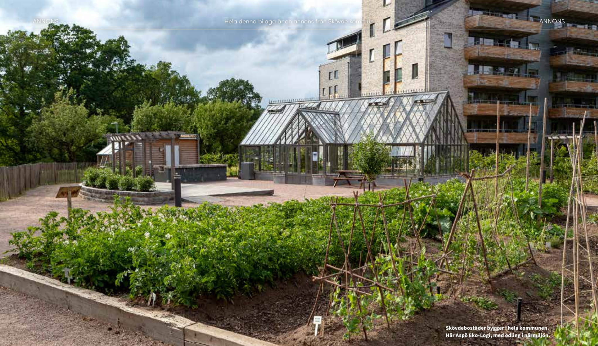
Skövdebostäder bygger i hela kommunen. Här Aspö Eko-Logi, med odling i närmiljön.