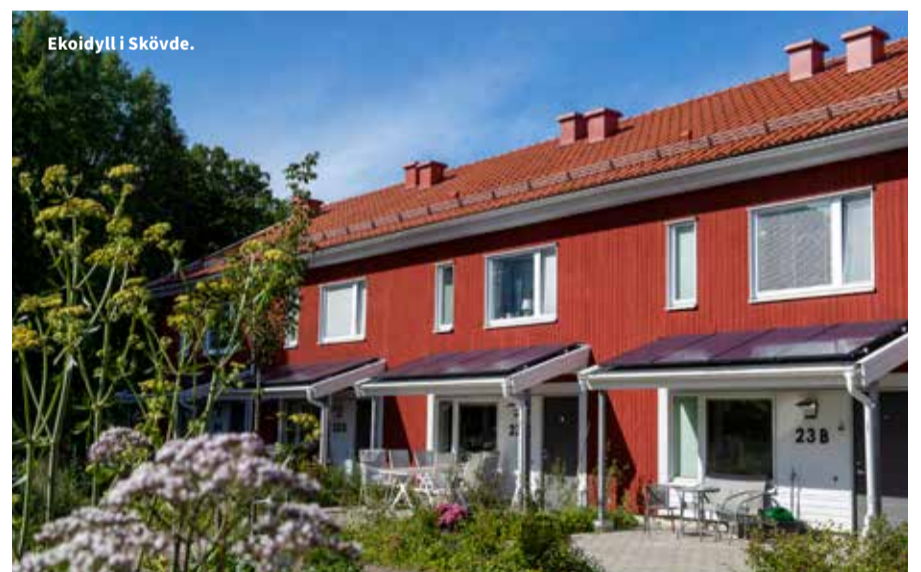
Ekoidyll i Skövde.

henne varmt om hjärtat och som ger inspiration till andra områden, både befintliga och nya – och även till Skövde Science City-Mariesjö.