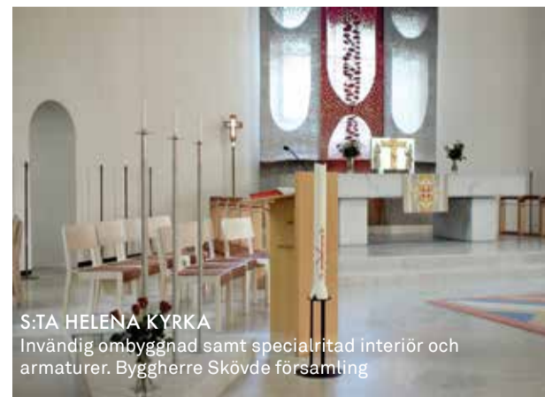
S:TA HELENA KYRKA Invändig ombyggnad samt specialritad interiör och armaturer. Byggherre Skövde församling