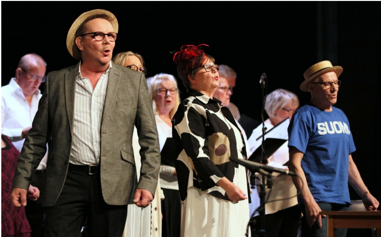
Från pjäsen "När Finland kom till Sverige" vid premiären 6/11.