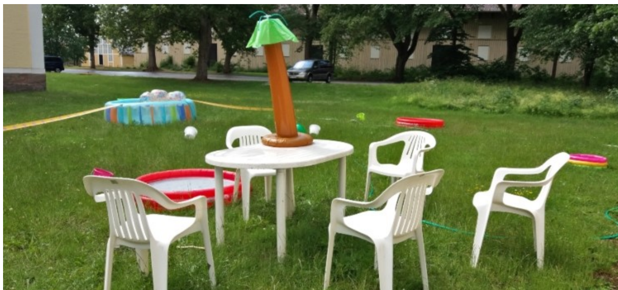
Bild från sommarlägret för barn och unga på Axevalla folkhögskola.

Sverigefinska Riksförbundets årliga sommarläger för barn och unga på Axevalla folkhögskola, "Lintjärven leiri", genomfördes enligt plan 12-17 juni. Lägeravgiften för två barn som är bosatta i Skövde kommun subventionerades med 1000 kr/barn.