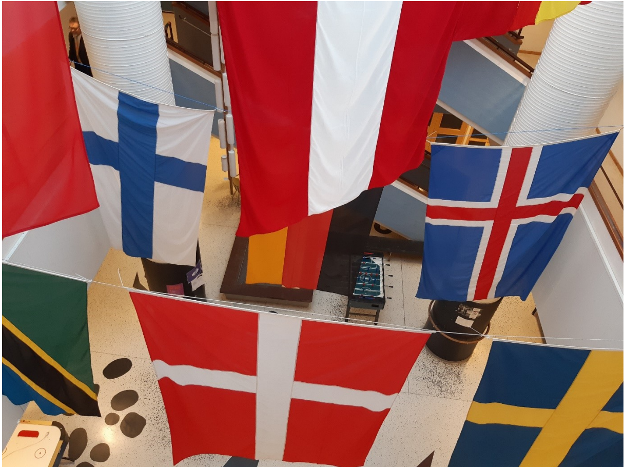
Språkdagen uppmärksammades på Vasaskolan 13/10.

Samordnaren deltog under Språkdagen på Vasaskolan den 13 oktober och lärde ut grunder i det finska språket för högstadieelever på skolan. Under Språkdagen får eleverna lära sig lite om flera olika språk, däribland finska.