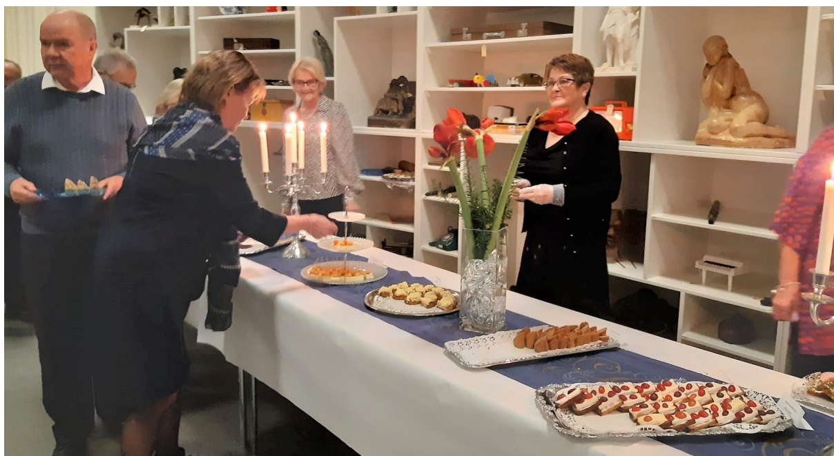
Serveringen under självständighetsfirandet hölls i Askebergasalen på Kulturfabriken.