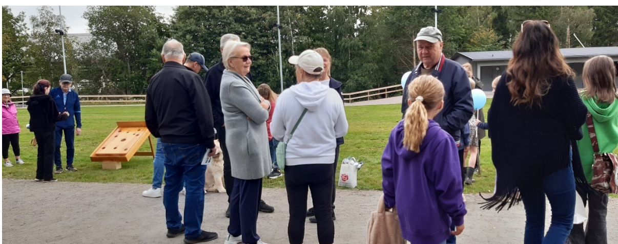
Hästsko- och kedjekastning på Friskvårdens dag på Billingen den 3 september.