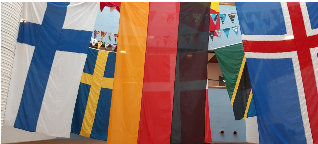
Språkdagen på Vasaskolan den 24 oktober.

Samordnaren deltog under språkdagen på Stöpenskolan den 26 september och på Vasaskolan den 24 oktober. Under språkdagen får eleverna lära sig lite om flera olika språk, däribland finska. Samordnaren deltog också i Västerhöjdsgymnasiets språkdag den 27 september med ett informationsbord.