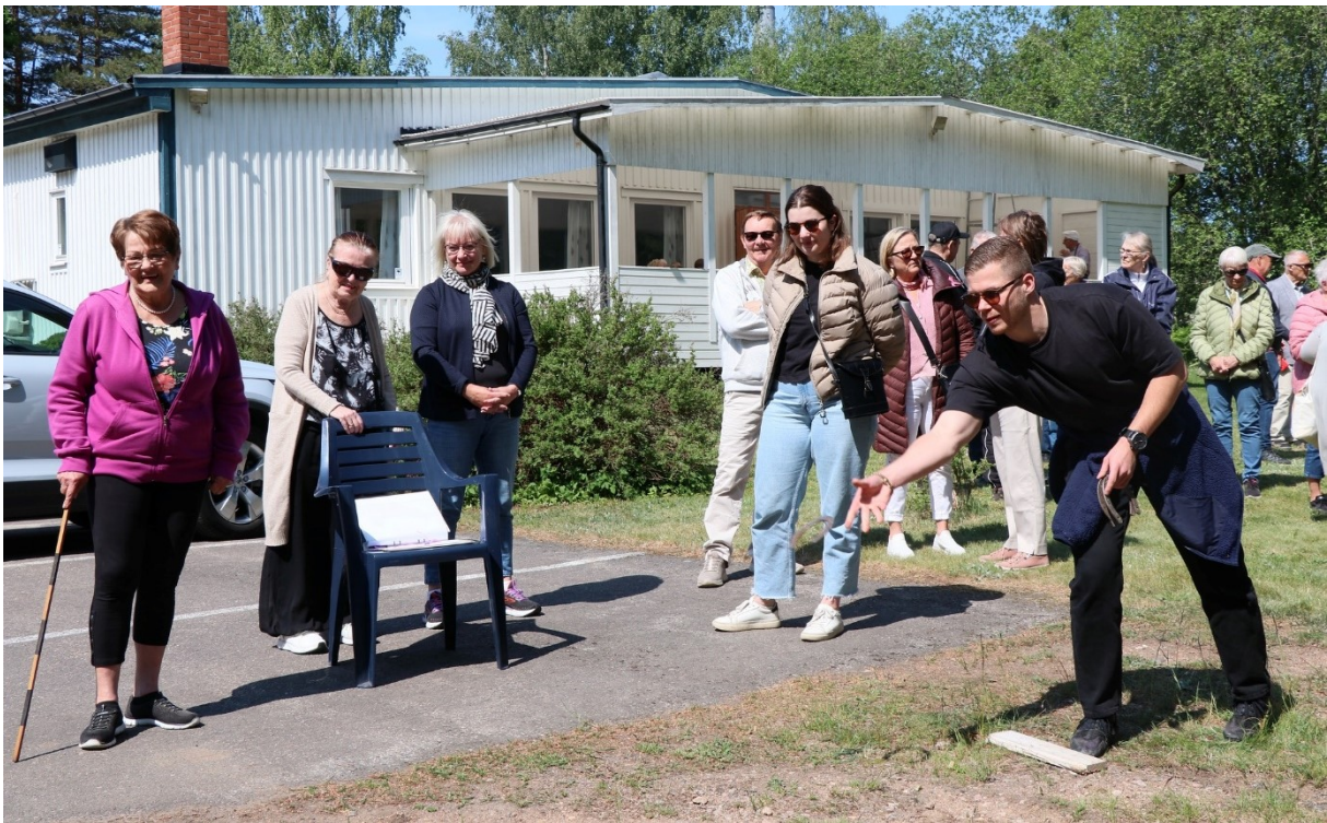
Besökarna på familjedagen fick prova på olika aktiviteter, exempelvis hästkokastning.