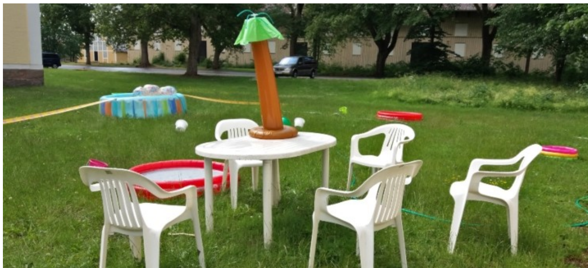
Bild från sommarlägret för barn och unga på Axevalla folkhögskola.

Sverigefinska Riksförbundets årliga sommarläger för barn och unga på Axevalla folkhögskola, ”Lintjärven leiri”, genomfördes 18-23 juni. Lägeravgiften för sju barn som är bosatta i Skövde kommun subventionerades med 1000 kr/barn, vilket är tre barn fler än 2022.