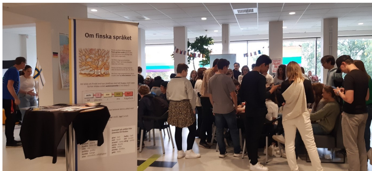
Språkdagen på Västerhöjdsgymnasiets den 27 september.