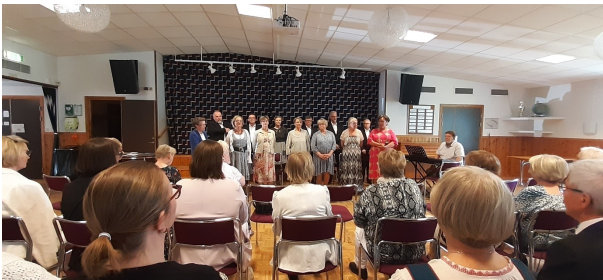
Konsertversion av pjäsen "När Finland kom till Sverige" under firandet av finska Mors Dag.