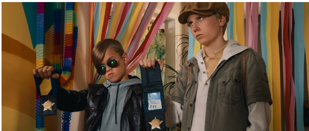
Etsivätoimisto/Detektivbyrå Henkka & Kivimutka

Under 2023 visades två finska filmer för barn på biograf Odeon. 17/2 Sihja – Kapinaa ilmassa (Sihja, rebellälvan) visades som sportlovsfilm med fri entré. Antalet tittare var 22. På höstlovet 3/11 visades Etsivätoimisto/Detektivbyrå Henkka & Kivimutka med 19 tittare (fri entré).