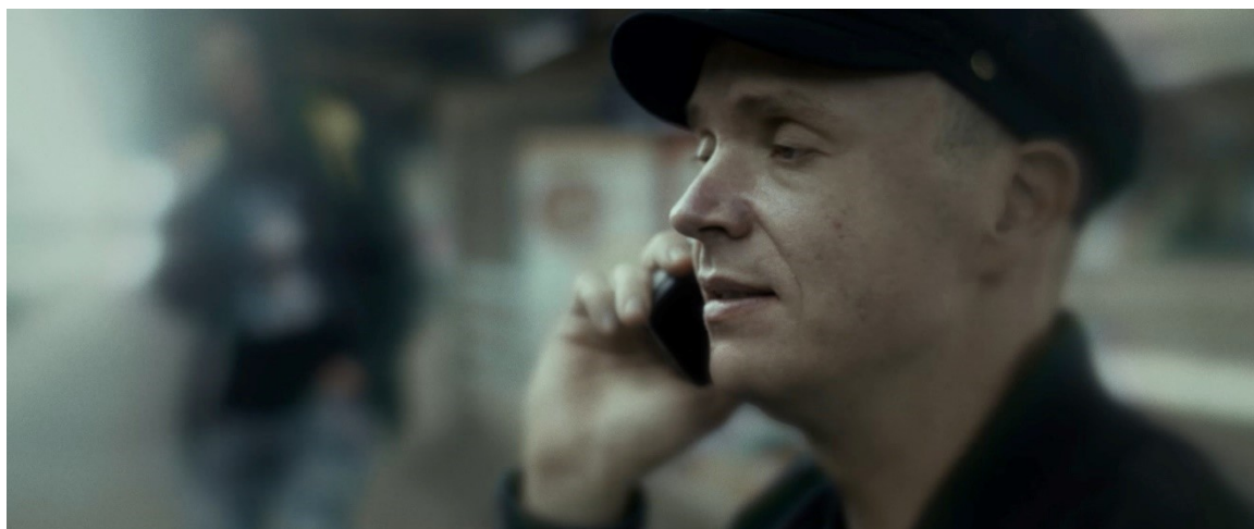
Den blinda mannen som inte ville se Titanic.