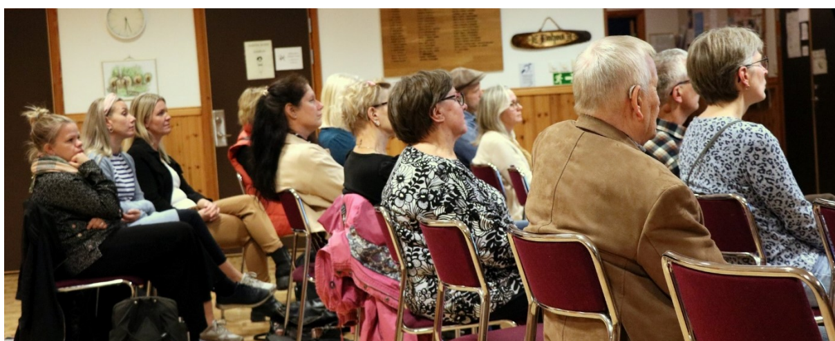
Flera föräldrar vars barn har modersmålsundervisning deltog.