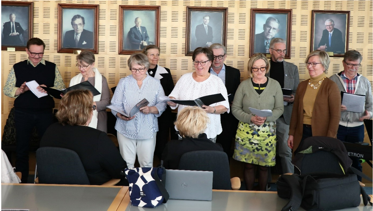
En sverigefinsk kör från Skaraborg uppträdde under Luleå kommuns besök 28 april.