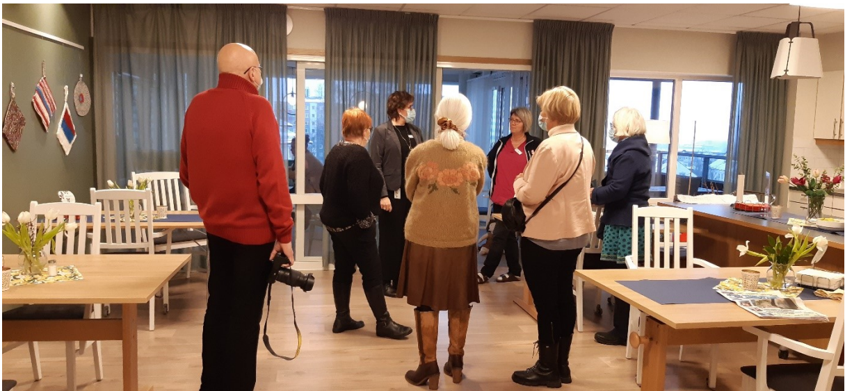
Sverigefinländarnas Delegation besöker avdelningarna med finskspråkig profil på Äldreboende Ekedal 20 januari 2023.

Sverigefinländarnas Delegation som gav Skövde kommun utmärkelsen "Årets sverigefinska kommun" 2021, besökte Äldreboende Ekedal i januari 2023.