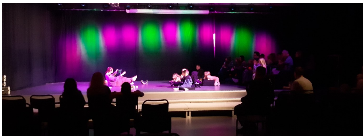
Tidfri/Aikavapaa med Uusiteatteri på Kulturlabbet.

Den tvåspråkiga barnteaterföreställningen Tidfri/Aikavapaa av Uusi Teatteri visades på Kulturfabriken under höstlovet 2/11 på initiativ av kulturavdelningen på Skövde kommun, som också stod för kostnaderna. Antalet personer i publiken var ca 40, varav 25 barn.