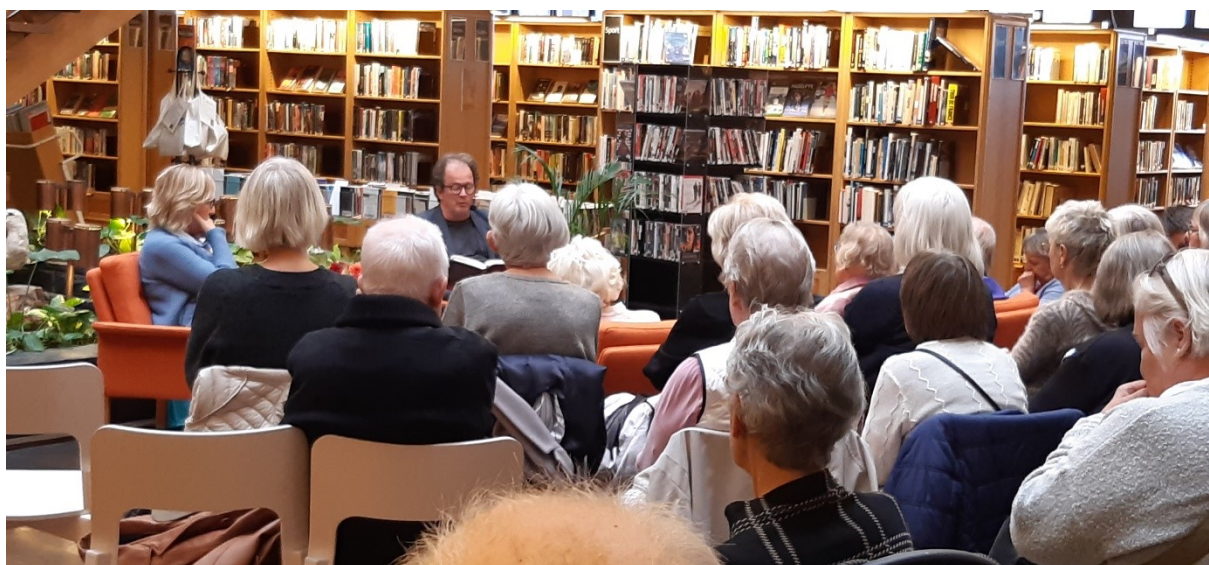
Den finlandssvenska författaren Kjell Westö på stadsbiblioteket 7/10.

Den finlandssvenska författaren Kjell Westö besökte stadsbiblioteket 7 oktober. Forum för poesi och prosa och finskt förvaltningsområde samarrangerade besöket. Antal besökare: ca 90 personer.