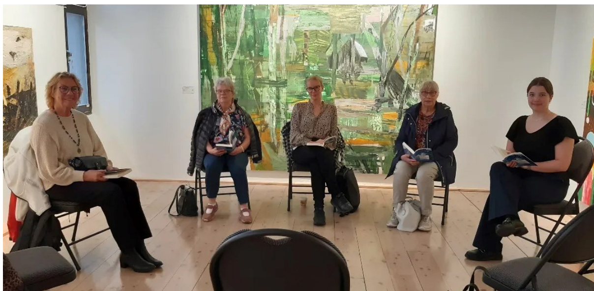
Bokcirkeln flyttade till Konstmuseet under hösten.