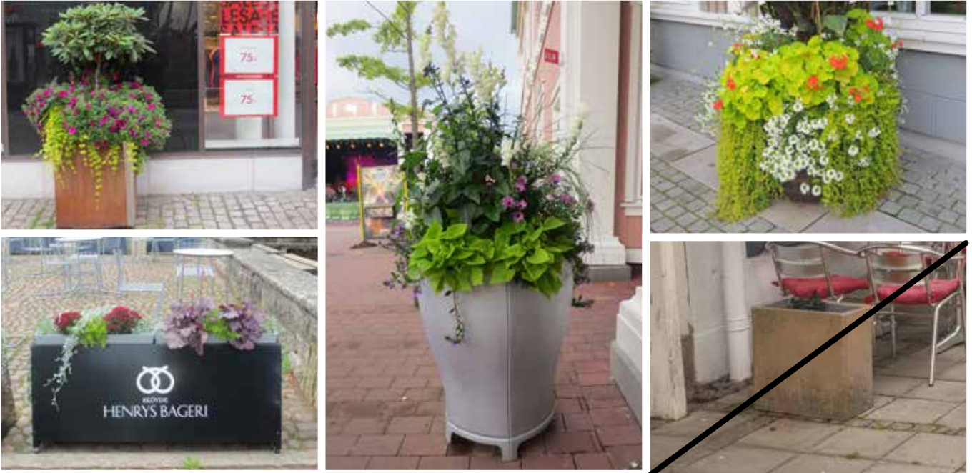
Urnor och planteringar ska vara välskötta