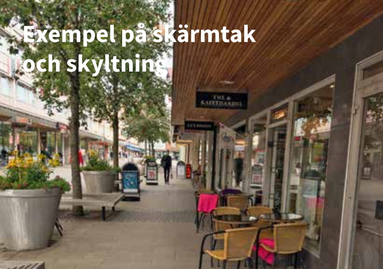
Exempel på skärmtak och skyltning