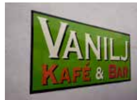
Typ 3 - logotyp som siluett monterad på vägg