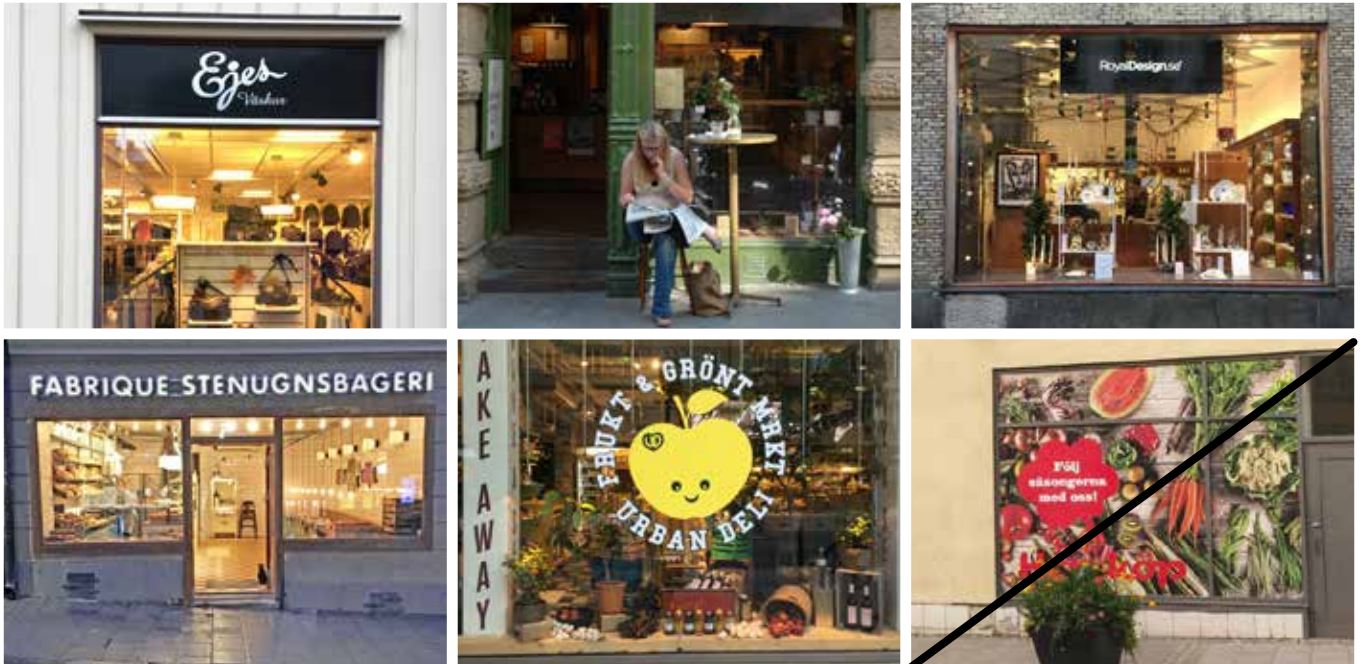
Permanent täckning av skyltfönster ska undvikas