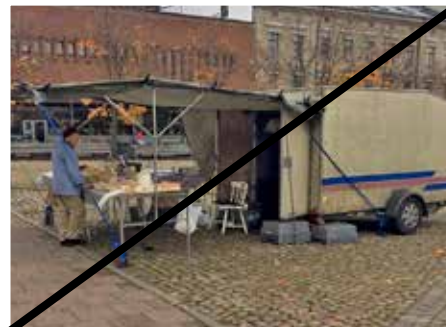
Gatustånd ska präglas av god design