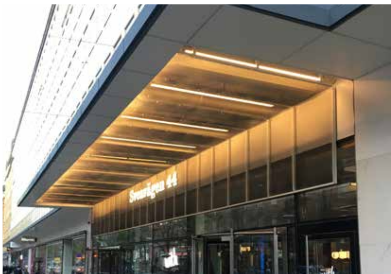
Exempel på arkadgångar