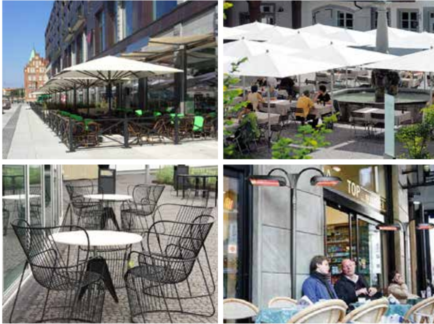
Exempel på infravärmare