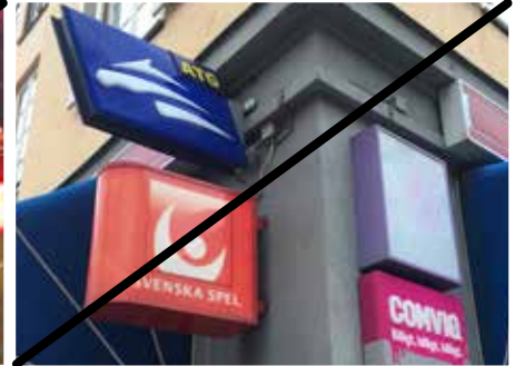
Fasadflaggor ska inte förekomma