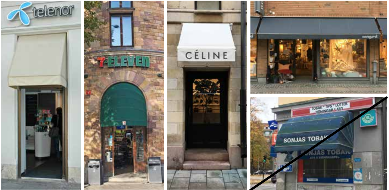
Markiser ska hållas hela och rena