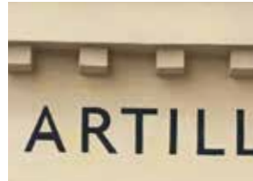
Typ 2 - emaljerad eller målad plåtskylt