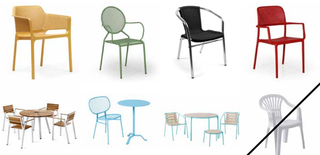
Vingliga trädgårdsmöbler i plast tillåts inte

För gatumöbler gäller liknande hänsyn som för blomsterurnor, det vill säga att de ska skötas, inte vara i vägen och vara stadiga nog att inte välta. Det kan exempelvis vara bra att ha bord med ben som går att justera eftersom möblerna även ska passa om underlaget lutar och/eller är ojämnt.