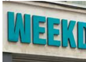
Typ 4 - fristående bakifrån belyst logotyp