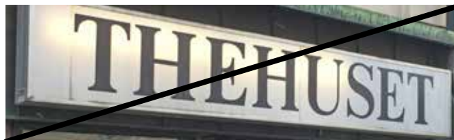
Innerbelysta skyltlådor med slät framsida ska inte förekomma