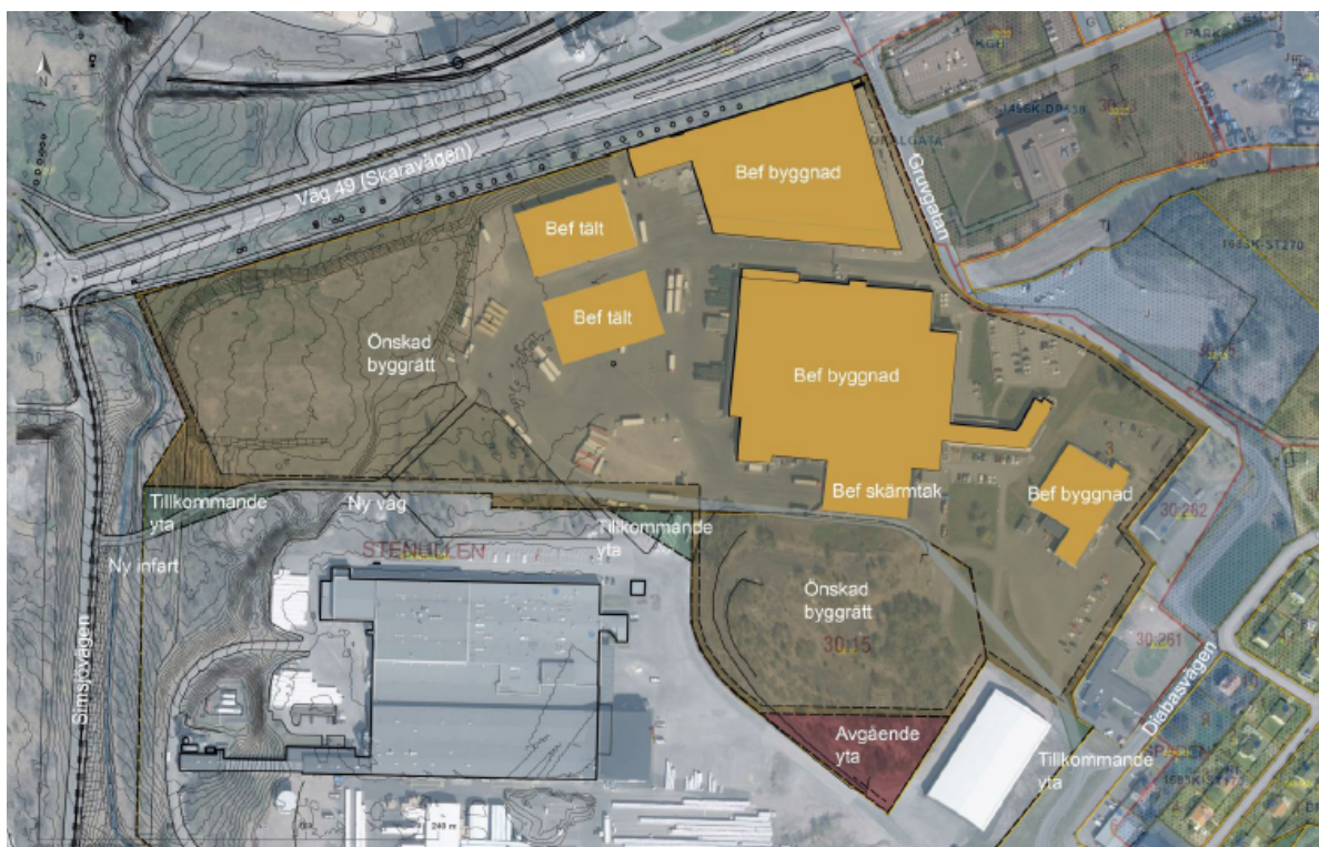
Situationsplan från ansökan

Skövde Logistikcenter AB, fastighetsägare till Stenullen 3 och Våmb 30:15, har ansökt om planbesked för upprättande av detaljplan för Stenullen 3. Syftet är att möjliggöra fortsatt goda expansionsmöjligheter för deras hyresgäst XR.