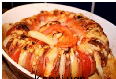
Korv i ugn