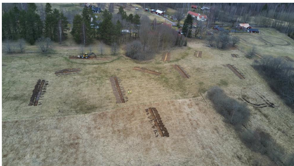
Foto: vy från söder mot talldungen som delvis bildar gräns för den norra delen av utredningsområdet.

utredningen ingående schakten nr 47 och 48 ingår i den sydvästra spetsen av det nu aktuella området).