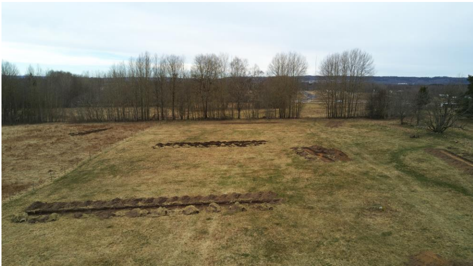
Foto: vy från öster, ungefär i områdets mitt del mot väster och Ingebrotomten/Trädgårdsstaden etapp 3 en bit bortom trädraden i bildmitt.

Effekten av utredningen är att det inte finns några fornlämningar i det nu utredda planområdet. Det medför att Västergötlands museum som rekommendation meddelar att det inte föreligger något sådant hinder för fortsatt planering inom det aktuella utredningsområdet.