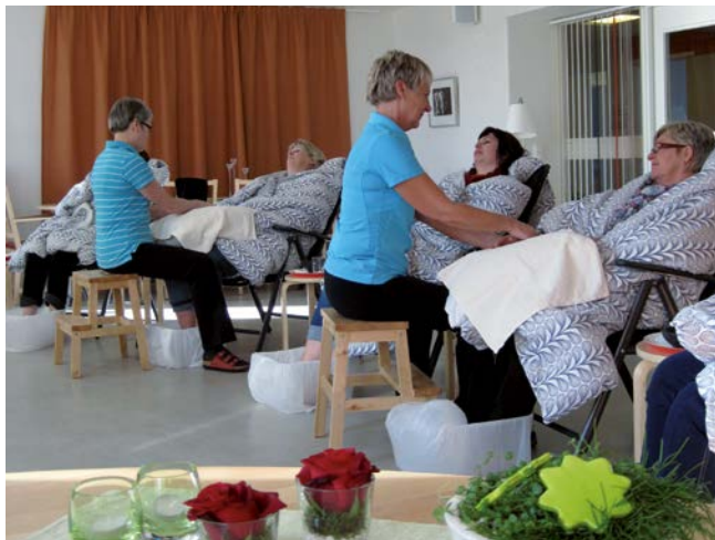
"Må bra" stund.

Du kan få taktil massage ett begränsat antal gånger, taktil massage är lätt beröring på kroppen. Vanliga effekter är att du blir avslappnad, må bra hormon frigörs, du får egen tid och blir lite ompysslad. Massagen ges i anhörigstödet's massagerum.