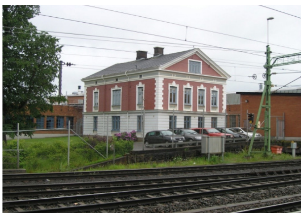
Kontorsbyggnad på Volvos område sett från järnvägen.

Västra stambanan avgränsar Volvos område i väster. Det innebär att mycket av tågresenärernas upplevelse av Skövde präglas av Volvo. Särskilt den sågtaksbyggnad i rött tegel (D-hallen) som följer längs spåren samt gamla kontoret som nämndes i tidigare stycke.