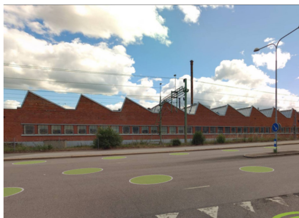
D-hallen med sitt sågtak.