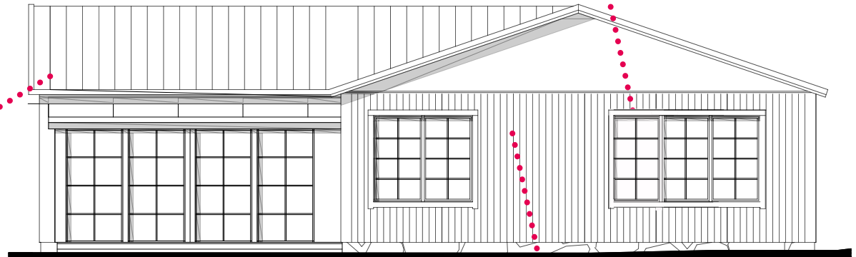
FASAD MOT SÖDER SKALA 1:100

Ritningen ska visa hur byggnaden är tänkt att se ut efter ändringen. Vill man ändra ett fönster ritas man fönstret som det ska se ut efter ändringen.