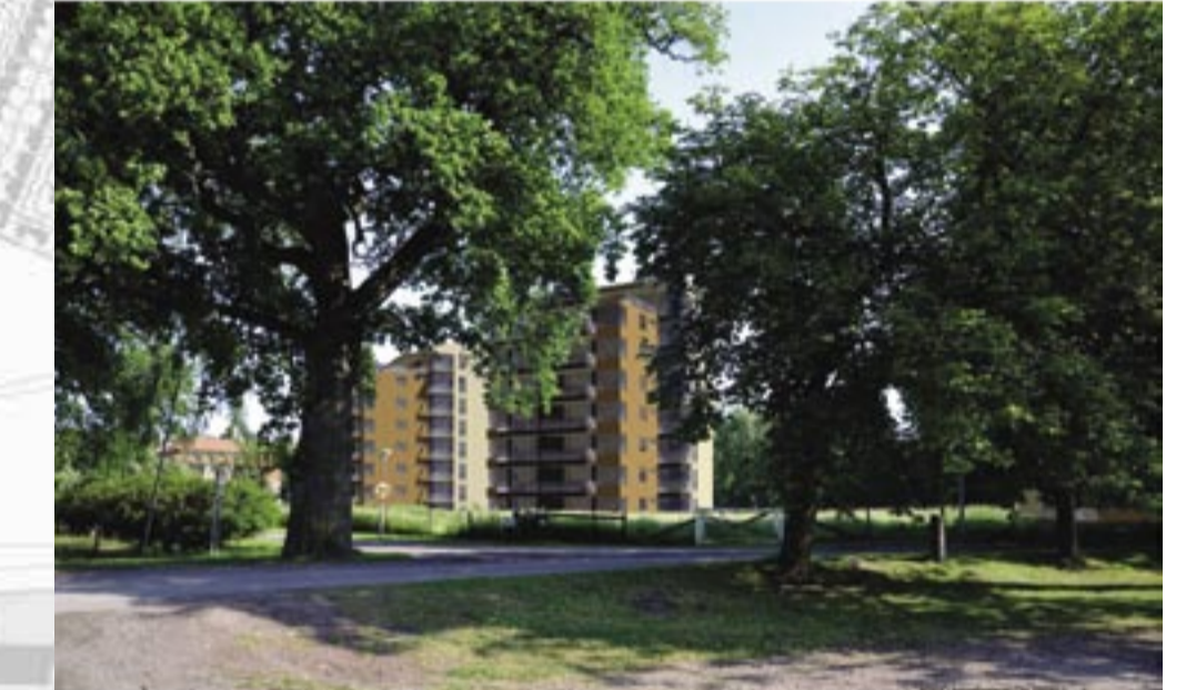
Fotomontage mot Aspö norra från befintlig parkering