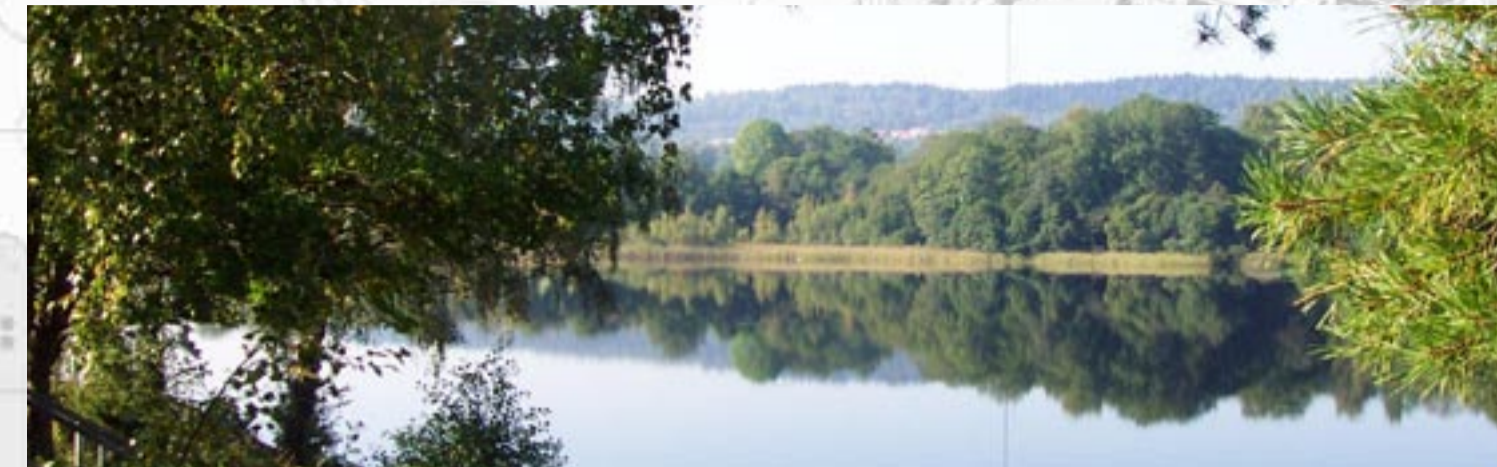
Karstors Fritidsområde Inom Karstors fritidsområde finns i den norra delen en fd backstuga (ca 1880) som tidigare varit bostad för lantarbetare vid Karstors gård. Stugan är timrad med rödfärgad panel och byggdes troligen som en enkelstuga som senare byggts till med ytterligare ett rum och kök. Byggnaden används säsongvis som kaffestuga.

Inom fritidsområdet finns även en omklädningsbyggnad samt en förrådsbyggnad i anslutning till anlagda fotbollsplaner.