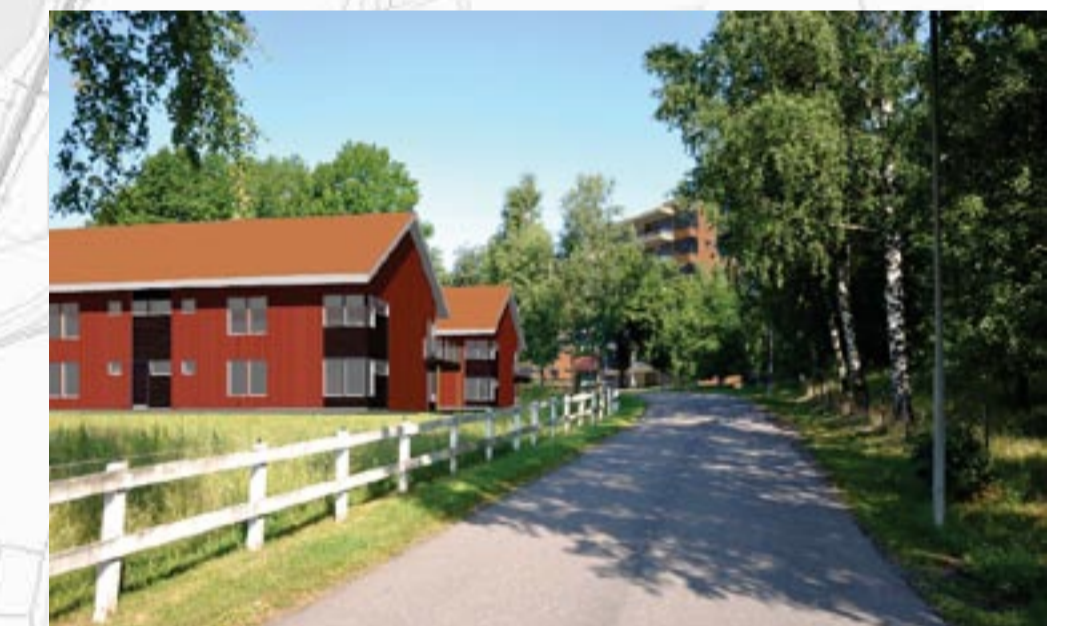
Fotomontage infarten till Aspö