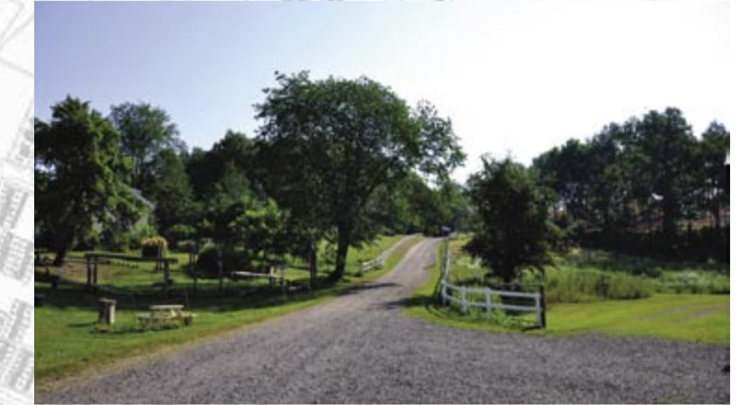
Fotomontage från Aspö gårdsplan upp mot infarten