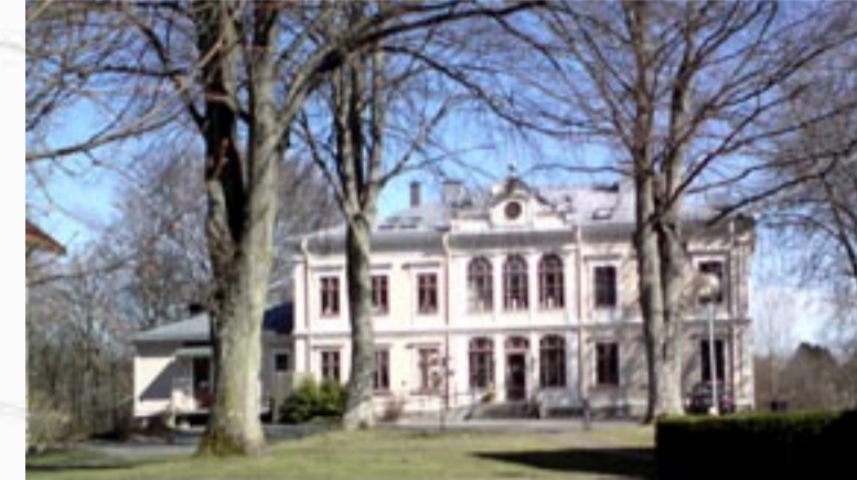
Karstors konferensanläggning Karstors Konferens har lokaler för konferenser och festväning samt övernattningsmöjligheter i 30 hotellrum (75 personer), relaxavdelning m m.