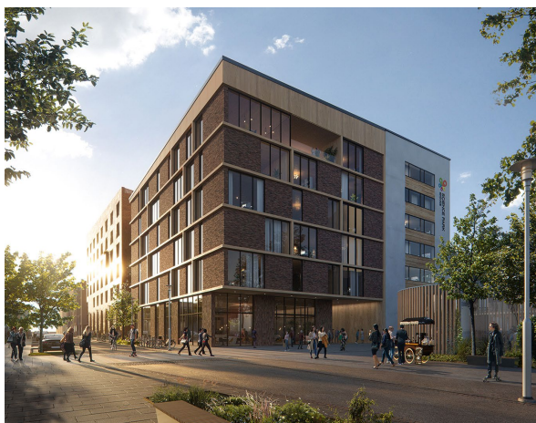
Illustration av Mareld Landskapsarkitektur.

Tillbyggnaden av Pergolan mot Kaplansgatan.