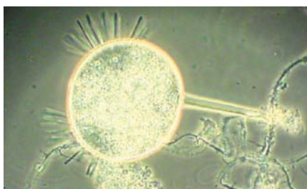
Mikroorganismer i avloppsvatten.

4.6. Huvudmannen kan i enskilda fall avtala om utsläpp i den allmänna avloppsanläggningen av avloppsvatten som i ej oväsentlig mån har annan sammansättning än hushålls- och avloppsvatten vad gäller arten eller halten av ingående ämnen. Huvudmannen bestämmer därvid villkoren för utsläpp av såväl spill- som dagvatten.