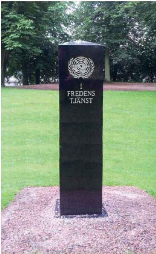
Bild 2. Utformning veteranmonument

Samråd med Sektor medborgare och samhällsutveckling har skett på tjänstemannanivå då monumentet ses som en utsmyckning och inte ett konstverk.