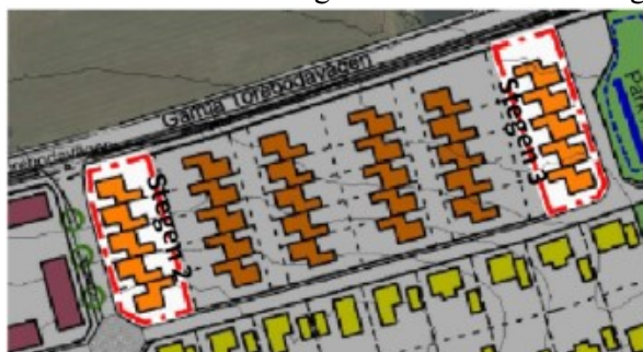
Utsnitt ur illustrationsplan (plankarta 2) för den gällande detaljplanen. Planeringsområdena markerade med röd linje.

För fastigheterna Stegen 2 och Stegen 3 föreslås ändringen av detaljplanen medge att gällande planbestämmelserna för utnyttjandegraden (e1 och e2), som totalt medger en bygggrätt om ca 43% av fastighetens storlek, ersätts med ny planbestämmelse (e4) med en utnyttjandegrad som medger att högst 50% av fastighetens yta får bebyggas. Detta medför att den maximala utnyttjandegraden ökar med totalt ca 15% för de berörda fastigheterna. Den upplevda ökningen bedöms dock vara betydligt mindre än så, se illustrationer nedan. Ändringen av detaljplanen föreslås fortsatt tillåta bostadstyperna flerbostadshus , radhus och kedjehus . Även övriga planbestämmelser om markens anordnande, placering och utformning etc. ska fortsatt gälla för de berörda fastigheterna.