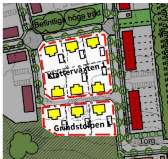
Utsnitt ur illustrationsplan (plankarta 2) med den föreslagna ändringen. Planeringsområdena markerade med röd linje.