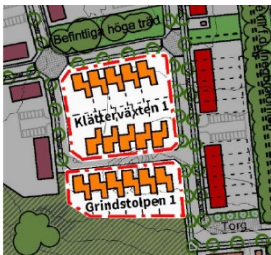
Utsnitt ur illustrationsplan (plankarta 2) för den gällande detaljplanen. Planeringsområdena markerade med röd linje.