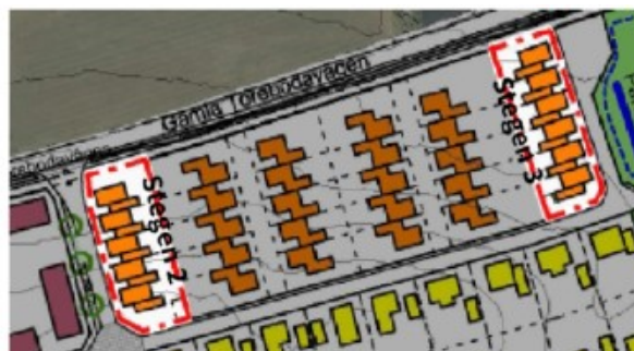
Utsnitt ur illustrationsplan (plankarta 2) med den föreslagna ändringen. Planeringsområdena markerade med röd linje.